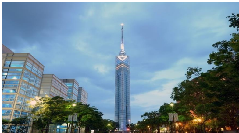
Fukuoka Tower หอคอยตึกระฟ้าที่สูงที่สุดในประเทศญี่ปุ่นถึง 234 เมตร

ท่านสามารถลงไปเที่ยวอิสระตามอัธยาศัย หรือ ซื้อตั๋วเสริมของเรือที่ให้บริการอยู่ได้ ควรซื้อตั๋ว เสริมของทางเรือก่อนจะถึงจุดหมายที่ท่านต้องการ 1 วันเดินทาง