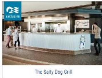
The Salty Dog Grill