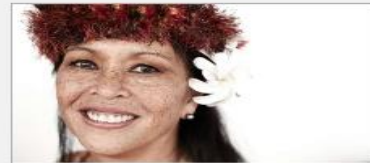
Festivals of the World