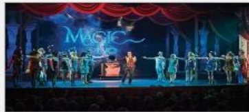
Original Musical Productions