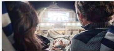
Movies Under the Stars®

On every Princess ship, you'll find so many ways to play, day or night. Explore The Shops of Princess, celebrate cultures at our Festivals of the World or learn a new talent – our onboard activities will keep you engaged every moment of your cruise vacation. 1