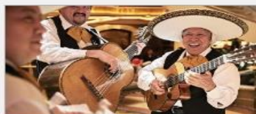
Music & Dancing