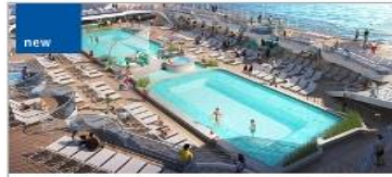
new Pools (Retreat, Wakeview, Top Deck)