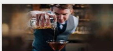
Good Spirits At Sea