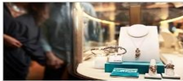
The Shops of Princess