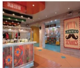
EL LOCO FRESH