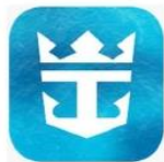
Royal Caribbean International App.