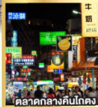
ตลาดกลางคืนโตง