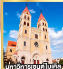
มหาวิหารเซนต์ไมเคิล