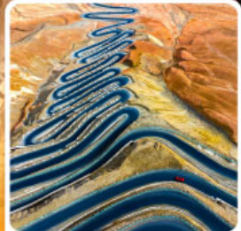
ถนนผานหลงกู่ต้า