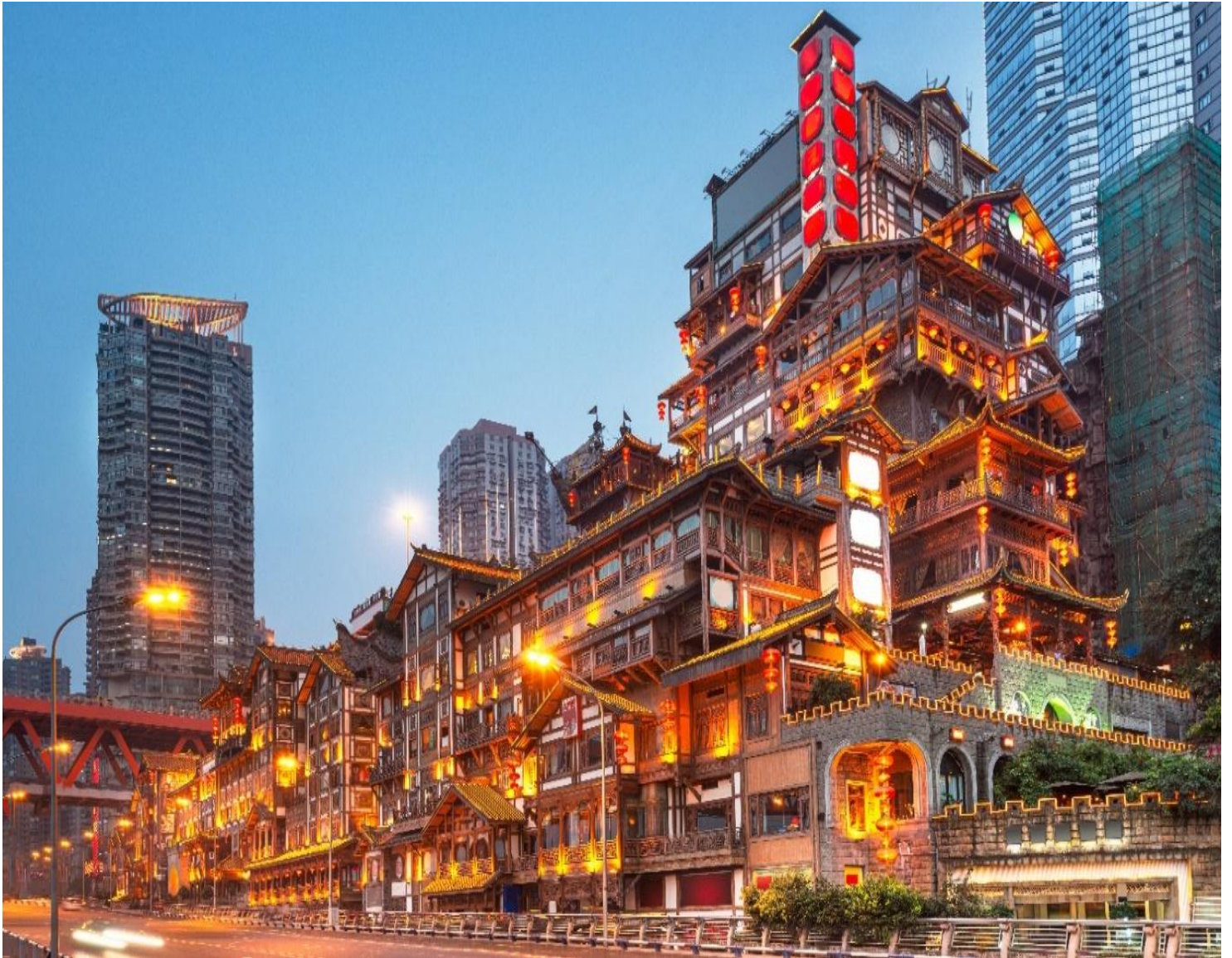
ค่ำ รับประทานอาหารค่ำ ณ ภัตตาคาร (มื้อที่ 4) เมนูพิเศษ สุกีซาบู หม่าล่า

จากนั้นนำท่านสู่ หงหยาดัง คอมเพล็กซ์ในรูปแบบทรงอาคารโบราณขนาดใหญ่ ภายในมีร้านค้า ร้านอาหาร ร้านขายสินค้าที่ระลึก ฯลฯ ที่นี่ถือเป็นจุดนัดพบพักผ่อนของชาวเมือง และจุดชมวิวชั้นดี อีกทั้งยังเป็น จุดถ่ายรูปที่สำคัญของนักท่องเที่ยวอีกด้วย