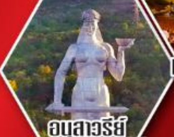
อนุสาวรีย์ มารดาแห่งจอร์เจีย