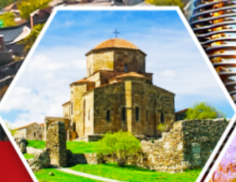
วิหารจอร์