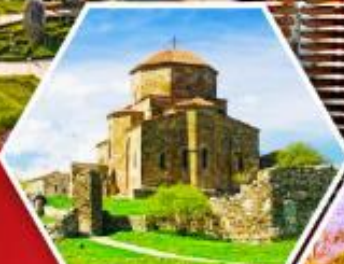
วิหารลอรี