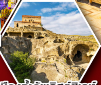
เมืองเก่าอพลิสต์ซิคเคห์