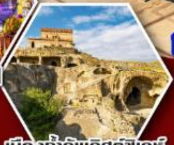
เมืองถ้ำอพิลิสต์ซิคห์