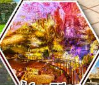
ถ้ำโพรมีธีอุส