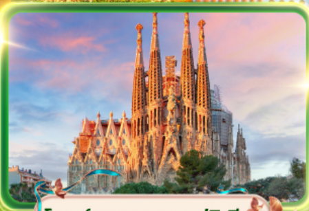
โบสถ์ซากราดา แพมิลี