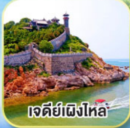
เจดีย์เฝิงโหล