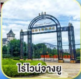
ไร์ไวน์จางยู