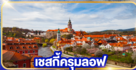
เซสท์ครุมลอฟ