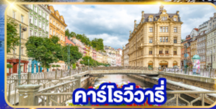
คาร์โรวาร์