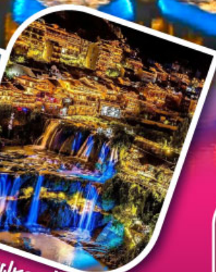
เมืองฝูหลงเจิ้น