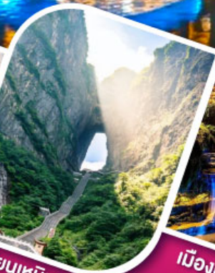
เจาเทียนเหมินทันฟ้าใส