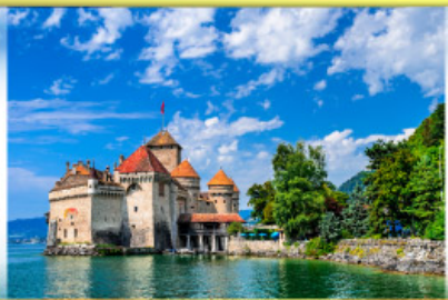
ปราสาทชิลยง