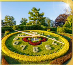
นาฬิกาดอกไม้เมืองเจนีวา