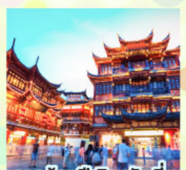
ตลาดร้อยปีเฉิงหวังเหมียว