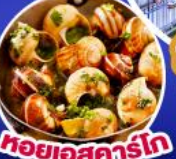
หอยเอสคาร์โก