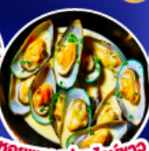
หอยแมลงภู่ออนันท์