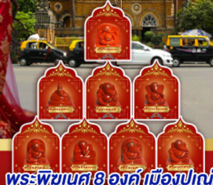
พระพิฆเนศ 8 องค์ เมืองปูณ