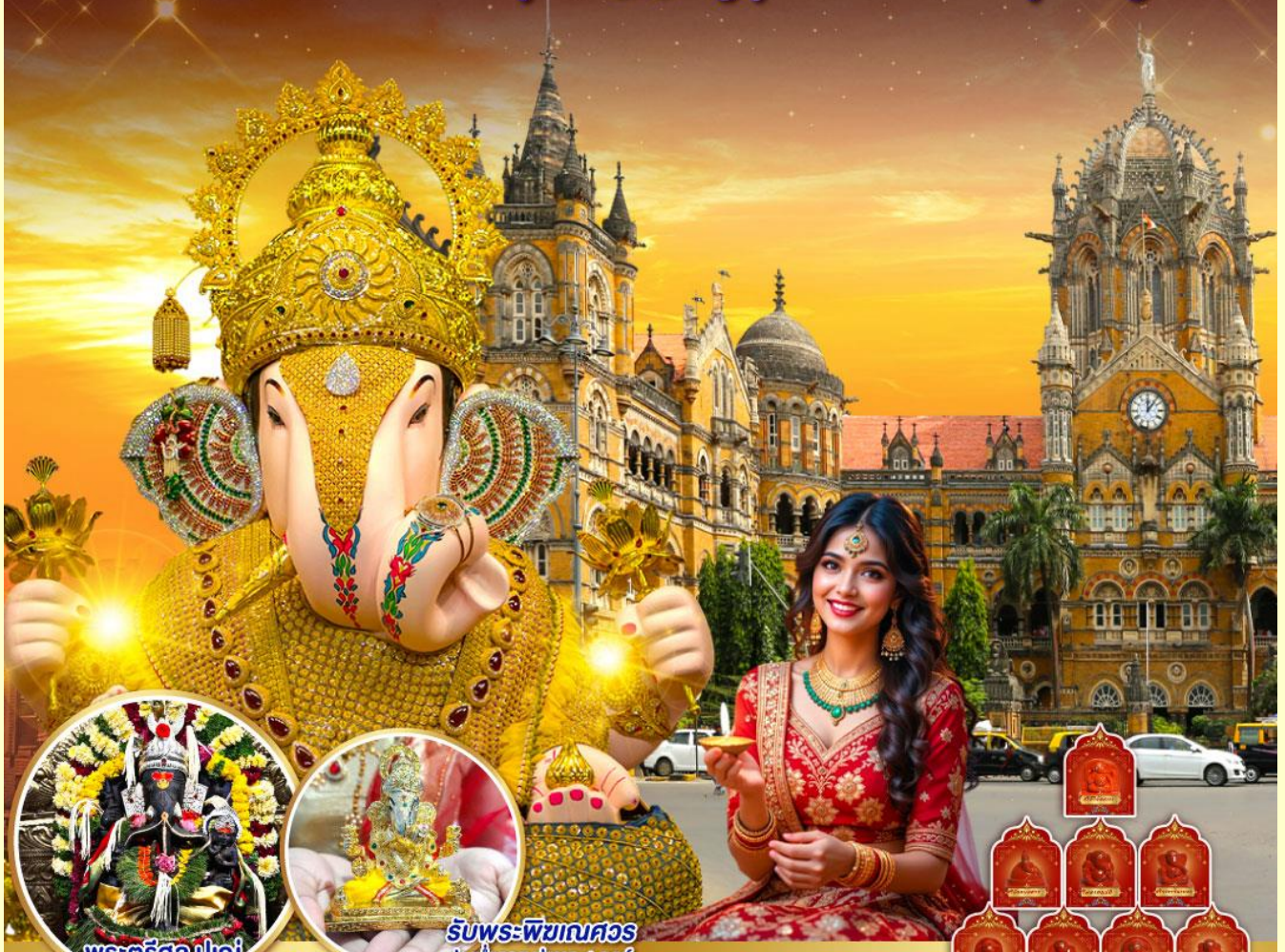
พระศรีศิว ปูณ (Trishul Pune)

เสริมชะตา จุดปัญญา มุสคิบัง มหานครมุมไบ ปูณ