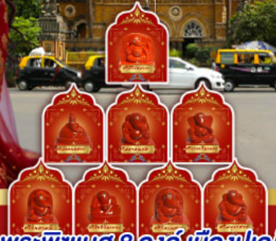
พระพิฆเนศ 8 องค์ เมืองปูณ

" อินเดียครั้งนี้ ไม่ใช่แคร์ิป แต่คือการเปลี่ยนแปลง ปลุกพลังในตัวคุณ... ด้วยพิธีกรรมศักดิ์สิทธิ์ ณ สถานที่จริง ของพระพิฆเนศ ดินแดนแห่งปญญาและพรสูงสุด"