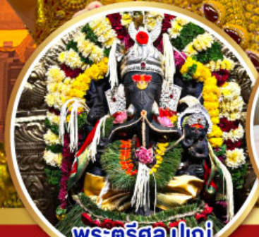
พระตรีศูล ปูณ (Trishul Pune)