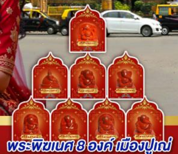
พระพิฆเนศ 8 องค์ เมืองปูณ