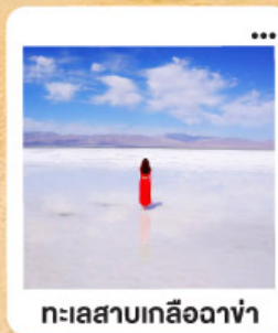
ทะเลสาบเกลือฉางซ่า