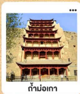
ถ้ำม่อเกา