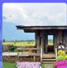
ร้านกาแฟหยุนตัน