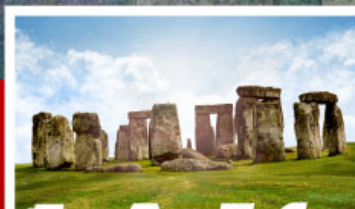
เยื่อนสโตนเฮ็นจ์ และ พิพิธภัณฑน์โรมันบาส