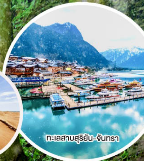
ทะเลสาบสุริยัน-จินกรา