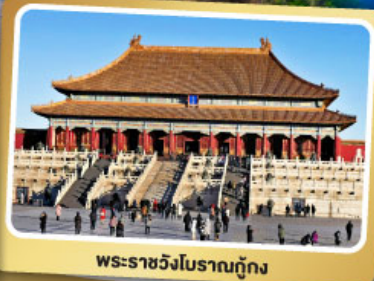
พระราชวังโบราณปักกิ่ง