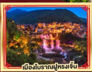
เมืองโบราณฟูหลงจั้น