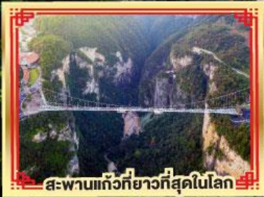
สะพานแกว่งที่ยาวที่สุดในโลก