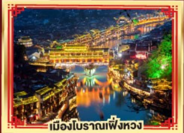
เมืองโบราณเฟิ่งหวง