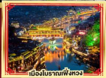
เมืองโบราณเฟิ่งหวง