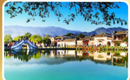
หมู่บ้านผดกโลก หงซุน