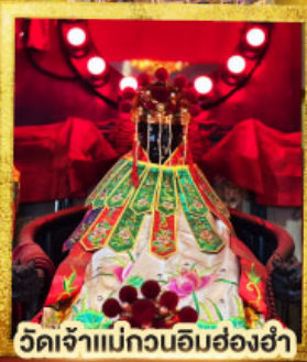
วัดเจ้าแม่กวนอิมฮ่องฮำ