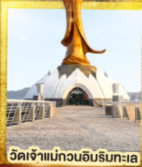
วัดเจ้าแม่กวนอิมริมทะเล