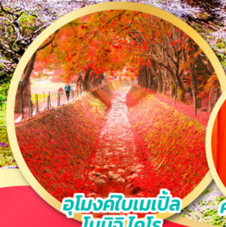
อุโมงค์ไบเมเบิล โมมิจิ โคโร