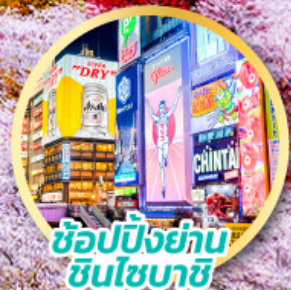
ช้อปปิ้งย่านชินโซบาชิ