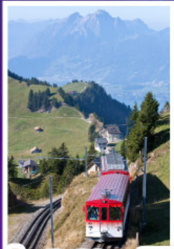
นั่งรถไฟใต้เขาเรริก