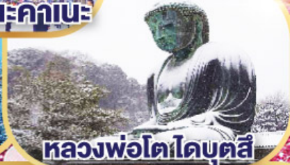
หลวงพอโตโดบตล