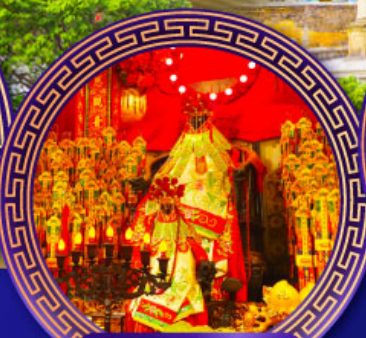
วัดเจ้าแม่กวนอิม ฮ่องกง