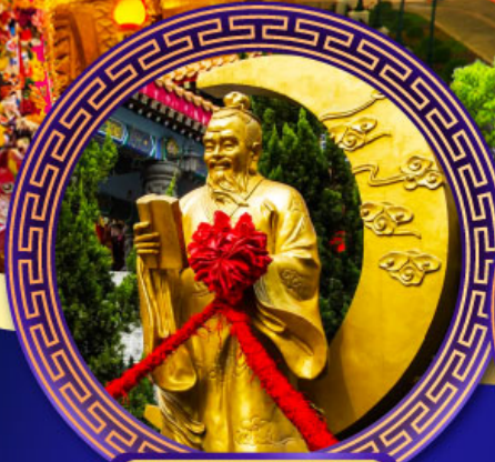
วัดหวังต้าเซียน