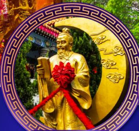
วัดหวังต้าเซียน