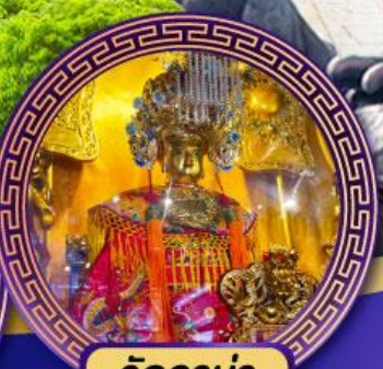
วัดอาม่า