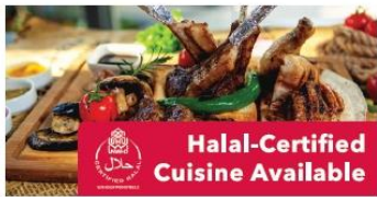
Halal-Certified Cuisine Available