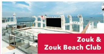
Zouk & Zouk Beach Club