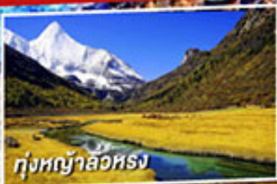
ทุ่งหญ้าลิวหรง