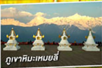
ภูเขาหิมะเหมยลี่