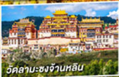
วัดลามะซงจ้านหลิน