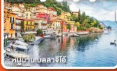
หมู่บ้านเบลลาจีโอ