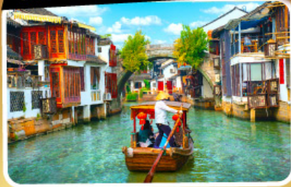
เมืองโบราณซูโจวเจียว