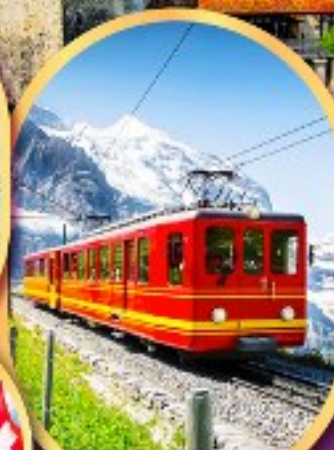
รถไฟฟู้ ยอดเขาจุงเฟรา