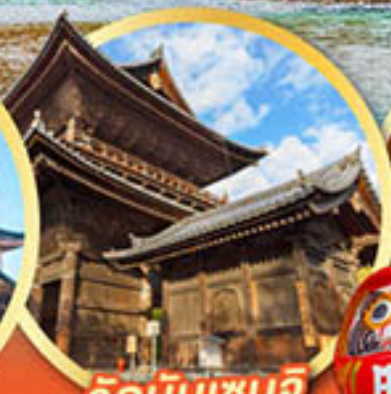
วัดนินเซินจิ