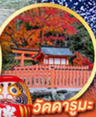
วัดคารุมะ