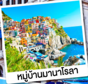
หมู่บ้านมานาโรลา