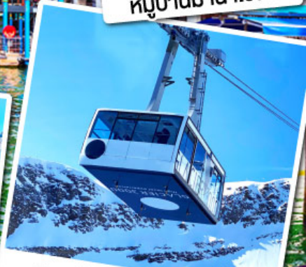
กระเช้ากลาเซียร์ 3000