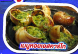
เมนูหอยแอสคาร์โท