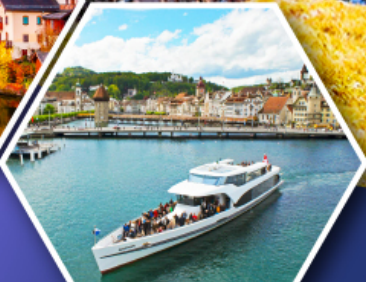
ล่องเรือทะเลสาบลูเซิร์น

การ์นตี แพ็คเกจข้ามบนยอดเขาพีลาตุส ยอดเขาคินมิงกรแห่งสวิตเซอร์แลนด์