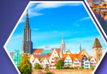
อูล์มบ้านเกิดไอน์สไตน์