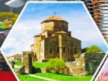
วิหารจอร์เจีย