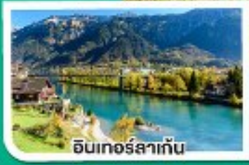
อินเทอร์ลาเก็น