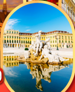
พระราชวังซินบรูนน์