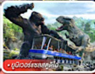
ยูนิเวอร์แซลส์ตูดิโอ