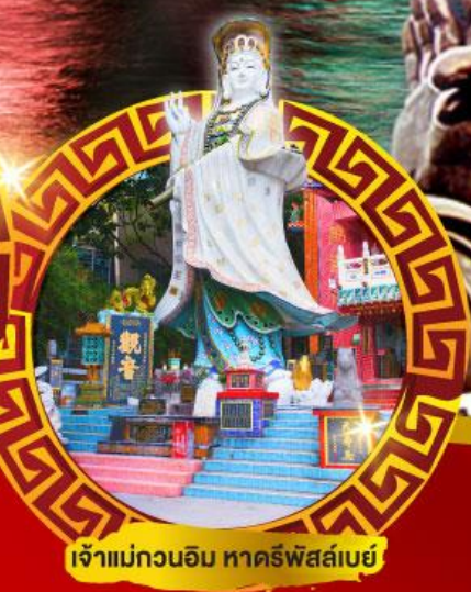
เจ้าแม่กวนอิม หาดริฟส์สมัย