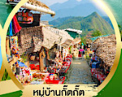
หมู่บ้านก๊ตก๊ต