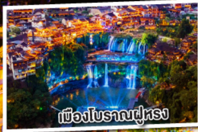
เมืองโบราณฝูหรง