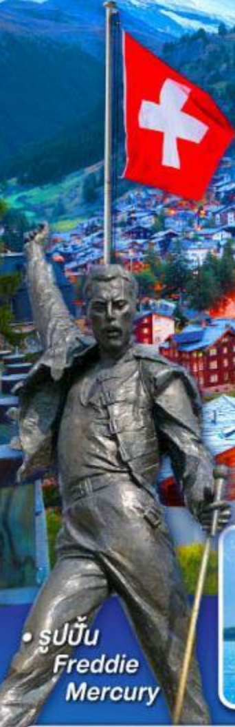
• รูปปั้น Freddie Mercury

พีชิต 5 เชาริกิ, เชาฮาร์เคอ์คุม, เชาจุงเฟรา เชาคลาเชียร์ 3000 และ เชากรอนเนอ์เกรต