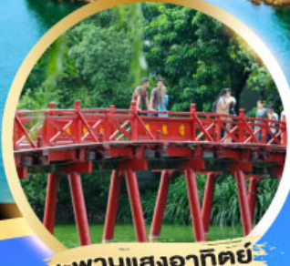
สะพานแสงอาทิตย์