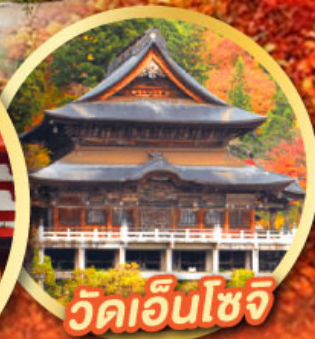
วัดเอ็นโซจิ

กิจกรรมเก็บผลไม้ พักออนเซ็น 2 คืน พักโรงแรมในโตเกียว 2 คืน