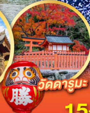
วัดดารุมะ