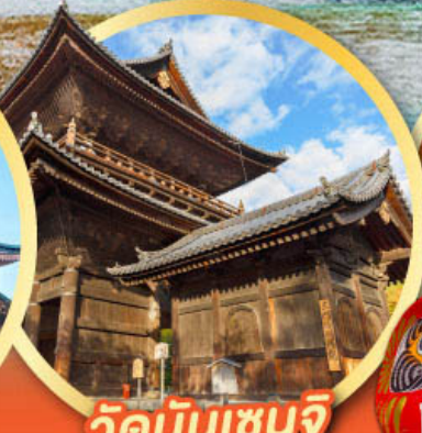
วัดนินเซนจิ