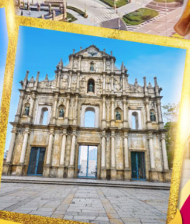
วิหารเซนต์ปอลเซนต์ปอล