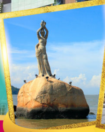
จูไห่ฟิชเชอร์เกิร์ล