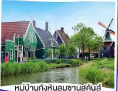
หมู่บ้านกังหันลมซานสคินส์